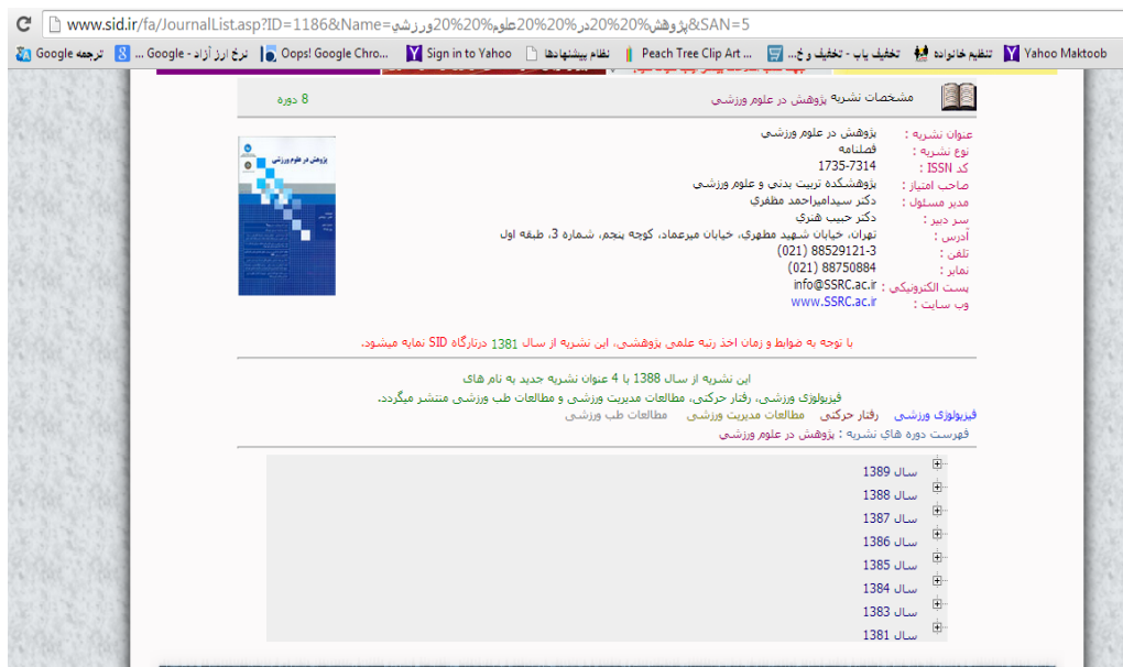
شکل شماره ۹

با امید به اینکه مطالب فوق مفید فایده بوده باشد، در شماره های بعدی، پایگاههای داده دیگری معرفی خواهند گردید. مشتاقانه پذیرای پیشنهادات شما هستیم.