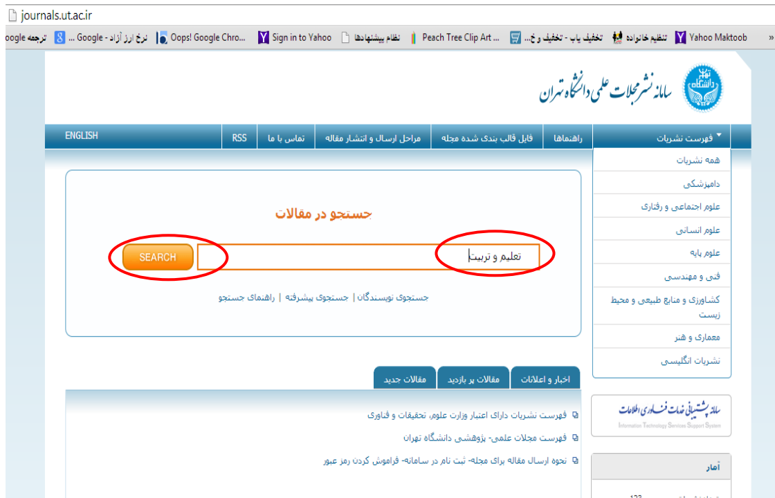
(شکل شماره ۱)