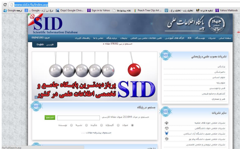
شکل شماره ۸