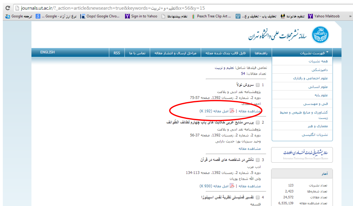
شکل شماره ۲